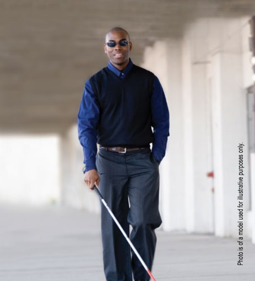
Photo is of a model used for illustrative purposes only.